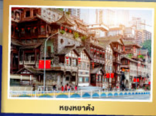
หยงหยาดัง