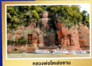
หหลวงฟอโตเล่อซาน