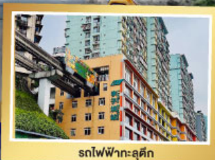
รถไฟฟ้า-ลู่ตัก