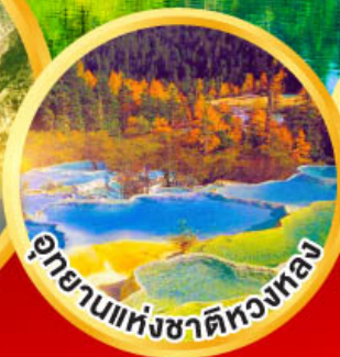
อุทยานแห่งชาติหลงหลง