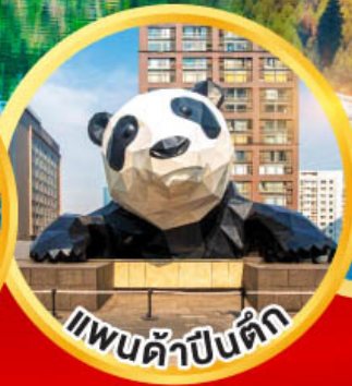
แพนด้าป็นดัก