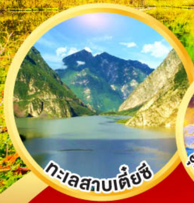
ทะเลสาบเตี้ยซี