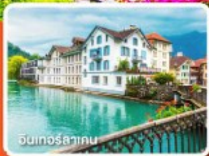
อินเทอร์ลาเกน