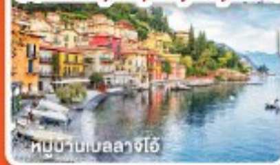
หมู่บ้านเบลลาจีโอ