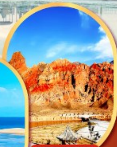
หุบเขาห้าสี อุทยานธรณีกุยเต๋อ