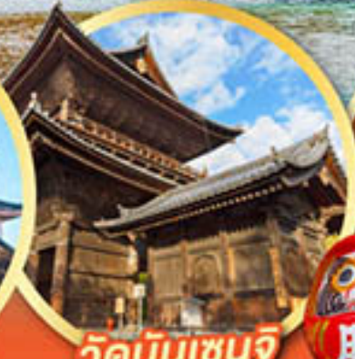
วัดนินเซินจิ