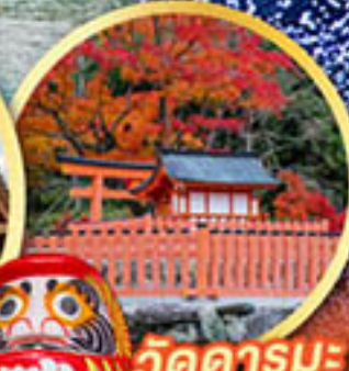
วัดคารุมะ