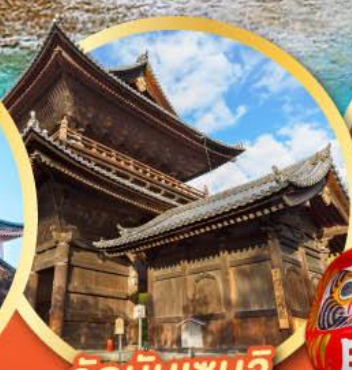
วัดนินเซนจิ