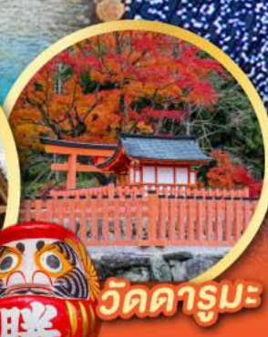
วัดคารุมะ