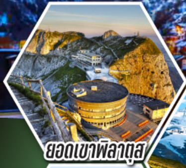
ยอดเขาพิลาตุส