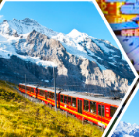
ยอดเขาจุงเฟรา