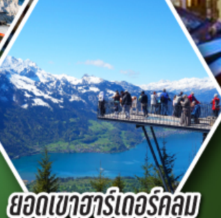
ยอดเขาฮาร์เดอร์คูลม

พักเมืองเซอร์แมท เมืองตากอากาศระดับโลก ที่มีฉากหลังเป็นยอดเขามัตเตอร์ฮอร์น ราคาเริ่มต้น