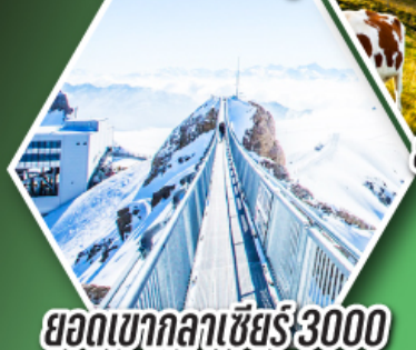
ยอดเขากลาเซียร์ 3000