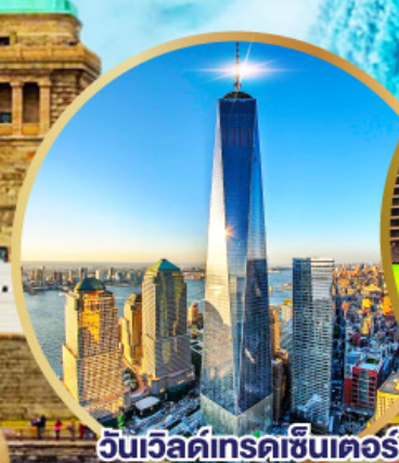
วันเวิลด์เทรดเซ็นเตอร์