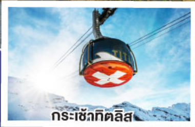
กระเช้าทีคลิส