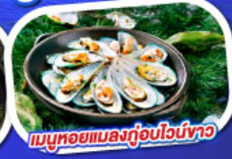
เมนูหอยแมลงภู่อบไวน์ขาว