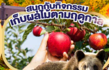
ฟาร์มหมีสึนาคาล