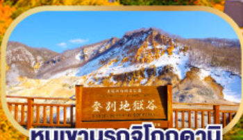
หุบเขานรกจิโกกุคานี

นั่งกระเช้าชมวิวฮาโกดาเตะ (รวมค่ากระเช้า)