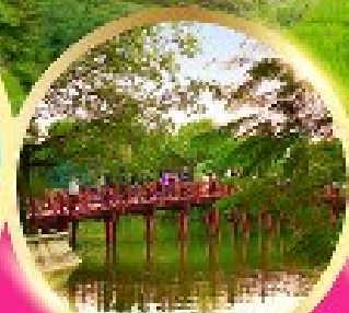
ทะเลสาบคินคาน