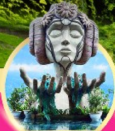
โมอาน่า ซาปา คาเฟ่