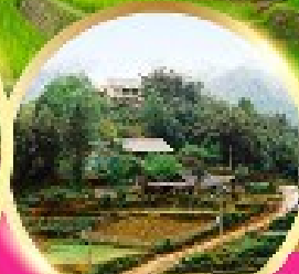
หมู่บ้านก๊อตก๊อต