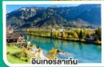
อินทอร์สากัน