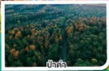
ปีจัตต้า

เดินทาง 20-26 ต.ค. 67 07-13 พ.ย. 67 05-11 ธ.ค. 67