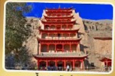
ถ้่าแก่สลักม่อเกา