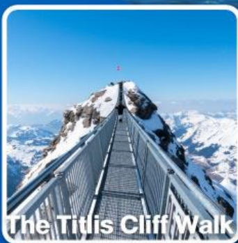
The Titlis Cliff Walk