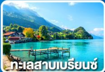
ทะเลสาบเบรียนซ์