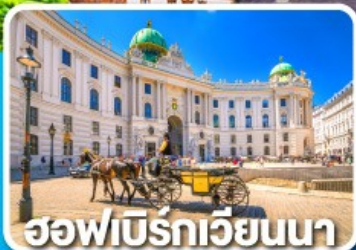
ฮอฟบิรทเวียนนา

ออสเตรีย เยอรมนี สวิตเซอร์แลนด์ 7 วัน 4 คืน