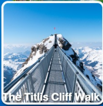
The Titlis Cliff Walk