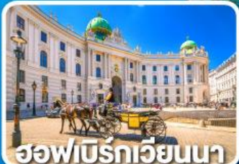
ฮอฟเบิร์กเวียนนา