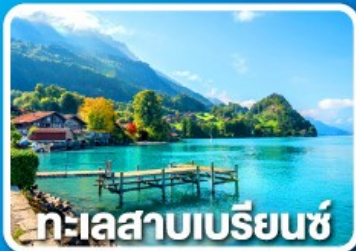
ทะเลสาบเบรียนซ์