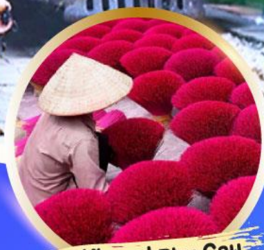
หมู่บ้านรูป Phu Cau