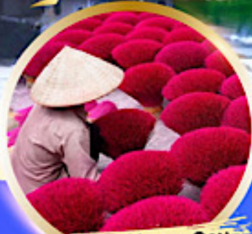
หมู่บ้านรูป Phu Cau