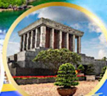
สุสานลุงโฮ