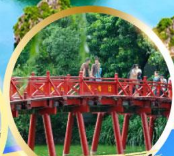
สะพานแสงอาทิตย์