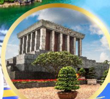
สุสานลุงโฮ