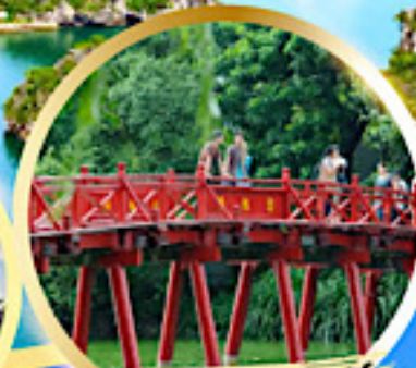
สะพานแสงอาทิตย์