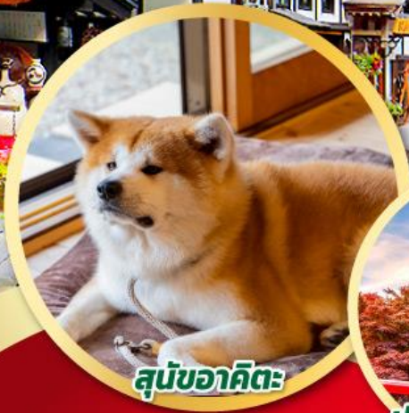
สุนัขอาคิตะ