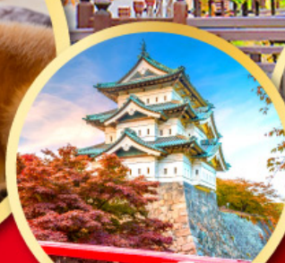
ปราสาทอิโรซากิ