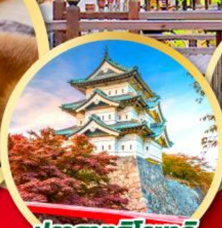
ปราสาทอิโรซากิ