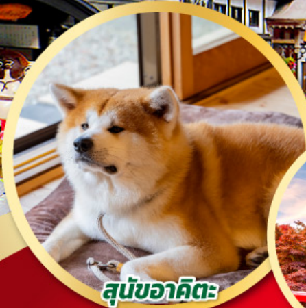
สุนัขอาคิตะ