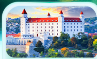
ปราสาทบราติสลาวา

เที่ยวชมเมืองฮัลส์สตัดท์ หมู่บ้านริมทะเลสาบสวยที่สุดในโลก พระราชวังเซินบรุนน์ เมืองลินซ์ จักรีสฮาพท์พลาซซ์ สัมผัสเมืองมรดกโลก เซสกี คุรมลอฟ เยี่ยมชมปราสาทปราก ถนนทองคำ เข็ควินสถานที่ชื่อดัง! ปราสาทบราติสลาวา ส่องเรือชมความงามแม่น้ำดานูบ แม่น้ำที่ยาวที่สุดในยุโรป ชมความน่าหลงใหลของ ปราสาทบูดาเปสต์ สะพานชาร์ลส์