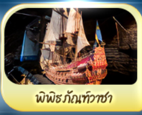
พิพิธภัณฑ์ทิวาชา