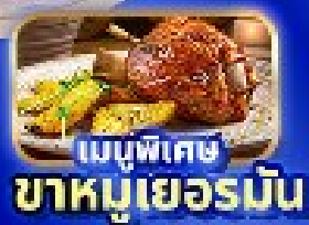
เมนูพิเศษ ขาคูเยอรมัน