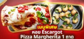
เมนูพิเศษ หอย Escargot Pizza Margherita 1 ถาด

แถมฟรี! น้ำดื่ม 1 ขวดทุกวัน, ปลั๊กไฟยูนิเวอร์แซล