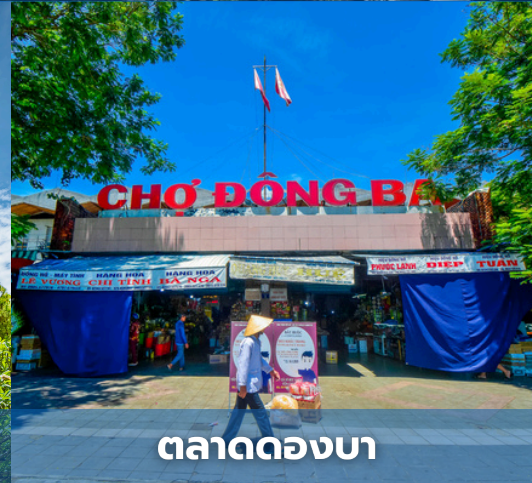
ตลาดดองบา

สำหรับเที่ยวบินที่แนะนำ : AIRASIA FD636 (DMK-DAD 10:30-12:10)