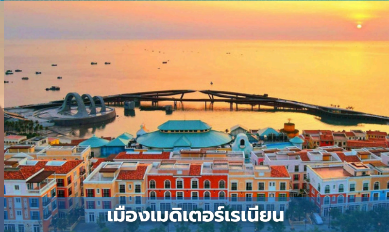
เมืองเมดิเตอร์เรเนียน