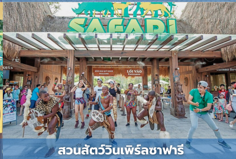
สวนสัตว์วินเพิร์ลซาฟารี