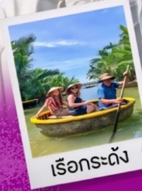
เรือกระดั่ง