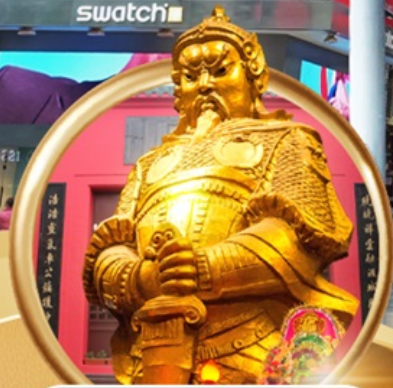
วัดเซกหงฮิว