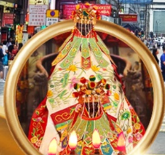
ยี่มเงินเจ้าแม่กวนอิมสองอา