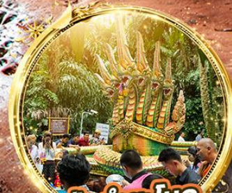
ปากำชะโนด