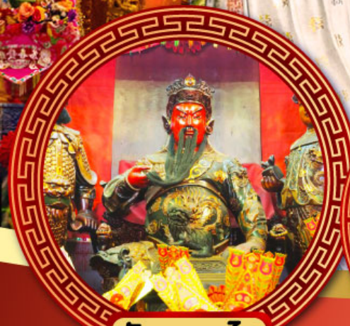
วัดกวนไท