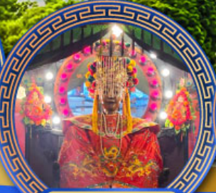
วัดเจ้าแม่ทับทิม