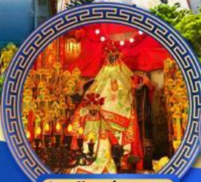
วัดเจ้าแม่กวนอิม ฮ่องกง