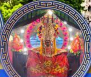
วัดเจ้าแม่ทับทิม