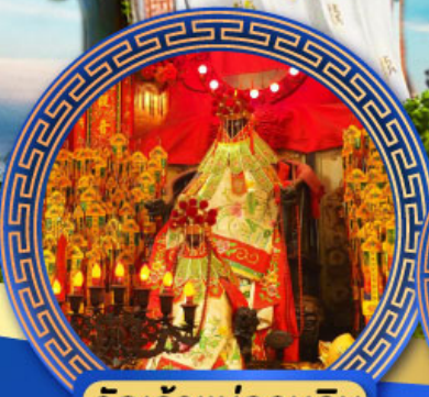
วัดเจ้าแม่กวนอิม ฮ่องกง