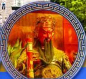
วัดกวนโถ