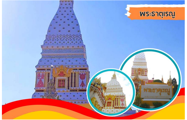
พระธาตุเรณู

นำท่านเดินทางไปยัง พระธาตุ เรณู พระธาตุประจำวันเกิดวัน จันทร์ พระธาตุเรณู ประดิษฐาน ณ วัดธาตุเรณู อ.เรณู ภายในบวรจุ พระไตรปิฎก พระพุทธรูปเงิน พระพุทธรูปทองคำ ของมีค่า มากมาย และเครื่องกฤษณ์ภัณฑ์ของ พระยาและเจ้าเมือง ของนครพนม เชื่อว่าผู้ใดได้ไปสักการะจะได้รับ