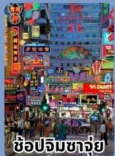
ช้อปปิ้งจางจู่ย