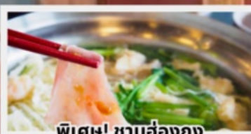
พิเศษ! ซาบูฮ่องกง