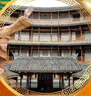
เมืองโบราณลั่วใต้