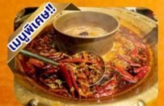
หม้อไฟเสฉวน