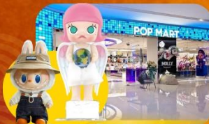
ซือปิงจุ่ม POP MART