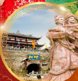
เมืองโบราณชงพาน