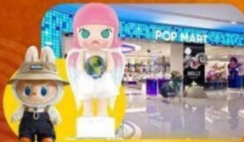
ซ้อปจุ่ม POP MART