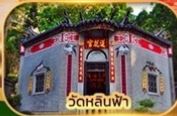
วัดหลินฟา