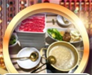
บุฟเฟ่ต์ชาบู เบื่อหรือไม่!!