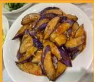
มะเขืออบหม้อดิน