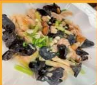
ไก่ผัดเห็ดหูหนู