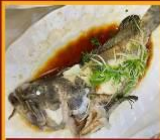
ปลานึ่งซีอิ๊ว