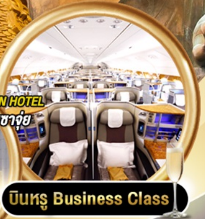
บินหรู Business Class