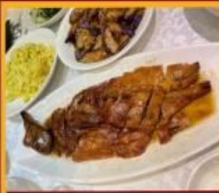
ท่านอย่าง