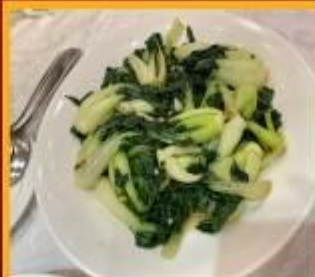
ผัดผักตามฤดูกาล