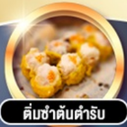
ติ่มซำต้นตำรับ

การ์ตูนดี!! พักหรู 4 ดาว THE KOWLOON HOTEL ติดถนนนาธาน ย่านช้อปปิ้งจิมซาจอย