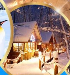
หมู่บ้านเทพนิยาย นิงเกิลทอเรส