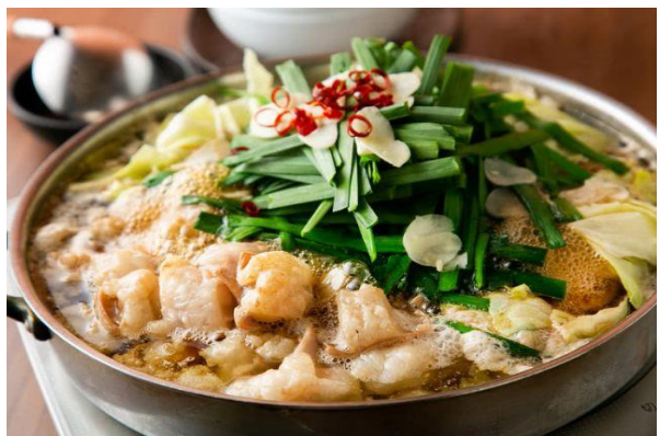
มตสึนาเบะ (Motsunabe)