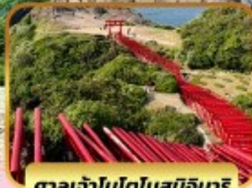
ศาลเจ้าโมโตโนสุมิอินาริ