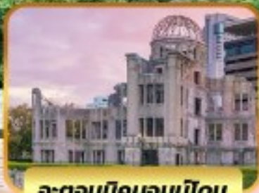
อะตอมมิคบอมบิโดม