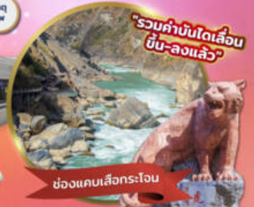
"รวมค่าบินได้เลื่อน ขึ้น-ลงแล้ว"