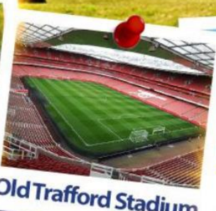
Old Trafford Stadium