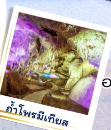
ถ้ำไฟรมีเทียส