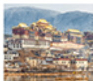
วัดซงจ้านหลิง