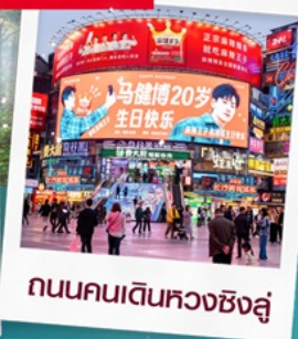
ถนนคนเดินหวงซิงสู