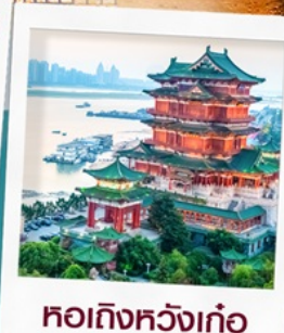
หอถึงหวังเก้อ