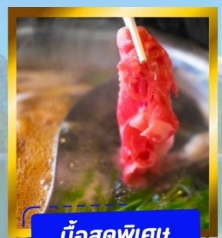
มือสุดพิเศษ