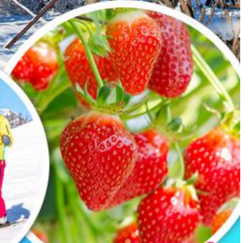
ไร่สตรอว์เบอร์รี่