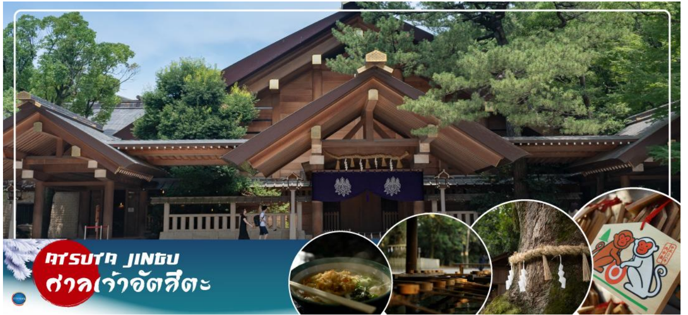
ATSUTA JINGU ศาลเจ้าอัตสึตะ

00.45 น. เห็นฟ้าสู่ เมืองนาโกย่า ประเทศญี่ปุ่น โดยเที่ยวบินที่ XJ638 สายการบิน AIR ASIA X ใช้เครื่อง AIRBUS A330-300 จำนวน 377 ที่นั่ง จัดที่นั่งแบบ 3-3-3 (น้ำหนักกระเป๋า 20 กก./ท่าน หากต้องการซื้อน้ำหนักเพิ่ม ต้องเสียค่าใช้จ่าย)