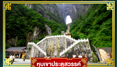
อุทยานประตูสวรรค์