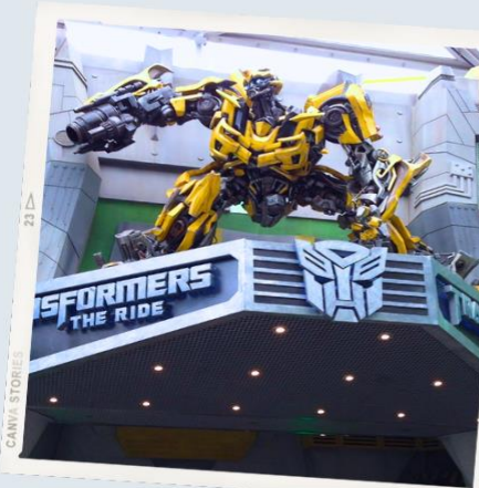
ZONE 1 : HOLLYWOOD