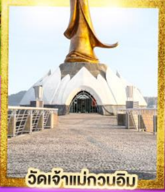
วัดเจ้าแม่กวนอิม

เดินทาง 20-22 ก.ย. 67 13-15, 18-20 ต.ค. 67 22-24, 25-27 ต.ค. 67 29 พ.ย.-01 ธ.ค. 67