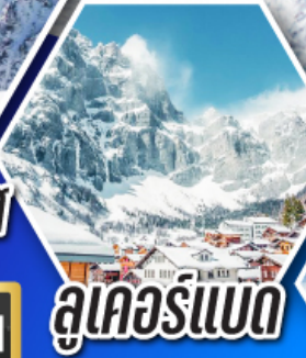
ลูคอร์เนอ