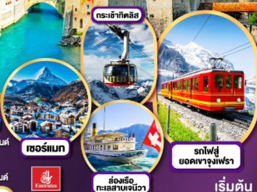
กระเช้ากิตลิส