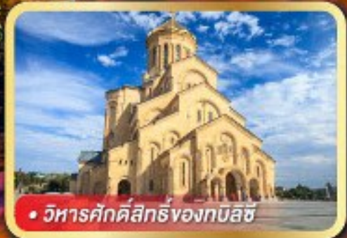
• วิหารศักดิ์สิทธิ์ของกบิลซี